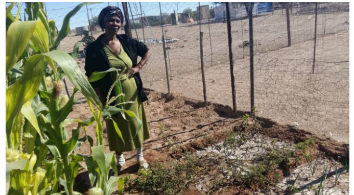
Garten der Albertville-Realschule Winnenden - Suppenküche

Ich habe viele Fotos von Gärten an den Suppenküchen bekommen. Einige warten auf die Ernte, weil ihnen ein Käfer alles, was gerade aus dem Boden sprießte, weggefressen hat. Aber es wurde auch schon geerntet! Wenn bei uns die Schnecken den Spinat weggefressen, ärgert